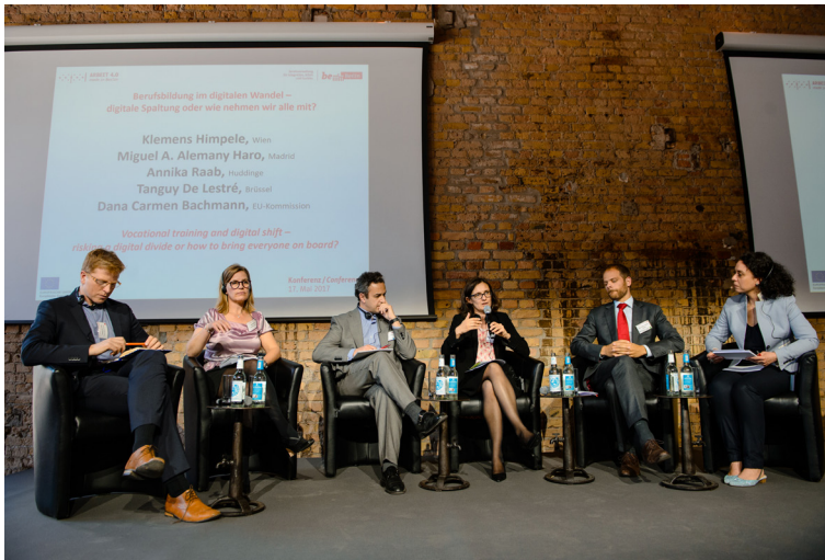
Im Panel 1 können Perspektiven der EU-Kommission, aus Wien, Brüssel, Huddinge und Madrid gewonnen werden.

Gesellschaftliche Partizipation und Integration hängen heute ganz maßgeblich auch von digitaler Bildung und digitalen Kompetenzen ab. Beide gehören aus Sicht der EU zu den Schlüsselkompetenzen lebenslangen Lernens mit Blick auf individuelle Entwicklung, gesellschaftliche Inklusion, aktives gesellschaftliches Engagement und Beschäftigung. Doch noch verfügt fast die Hälfte der Bevölkerung in der EU nur über unzureichende digitale Kompetenzen, unter der Erwerbsbevölkerung sind es knapp 40 Prozent. Metropolen nehmen hier eine besondere Rolle ein. Sie sind die nationalen Vorreiter und sind deshalb besonders gefordert, digitale Transformationsprozesse vor dem Hintergrund von Chancengerechtigkeit, Vielfalt und Integration zu reflektieren. Diskutiert wird, wie die Metropolen diesen Herausforderungen begegnen und auch welche Chancen die Transformationsprozesse bieten.