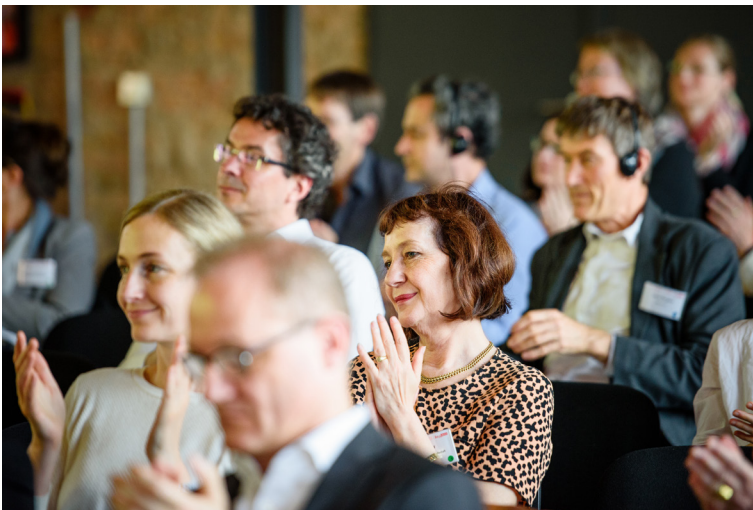
Das Publikum würdigt die abschließenden Worte des Staatssekretärs Alexander Fischer.

Die Ergebnisse der Konferenz werden durch die Senatsverwaltung für Integration, Arbeit und Soziales bis Anfang Juli im Online-Dialog aufgegriffen und diskutiert. Daraus wird anschließend das Grundlagenpapier „Digitale Kompetenzen in der Aus- und Weiterbildung“ entwickelt und veröffentlicht.