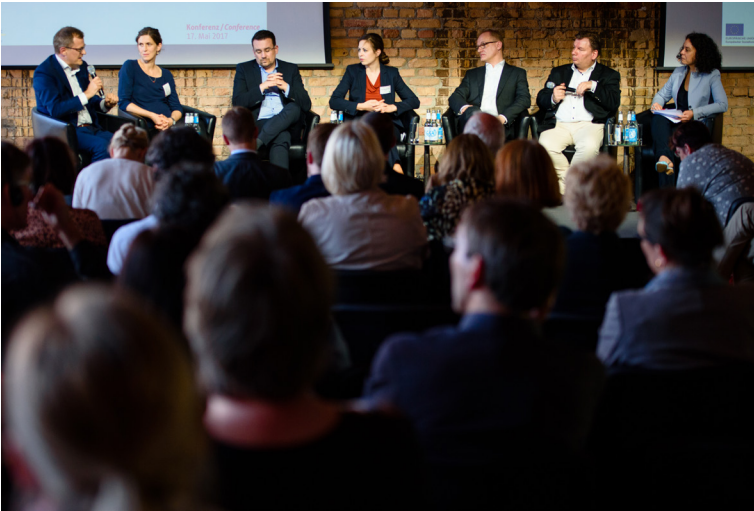
Im Panel 2 diskutieren die Podiumsgäste die Frage nach den digitalen Kompetenzen in der Berufsausbildung.

Der technologische und strukturelle Wandel führt zu einer Veränderung von Berufsbildern, Anforderungen und Wissensstandards. Berufsbiografien sind bereits heute dynamischer, vielfältiger und individueller – die Erwartung ist, dass sich diese Entwicklung noch verstärken und vertiefen wird. Im Panel wird diskutiert, welche Herausforderungen durch die Digitalisierung für den Arbeitsmarkt entstehen. Ein weiterer Diskussionspunkt ist, wie die Veränderung von Weiterbildungsangeboten erfolgen müsse und wie neue Lerninhalte mit neuen Methoden vermittelt werden könnten. Vor dem Hintergrund des Anspruchs „Guter Arbeit“ wird auch erörtert, wie lebensbegleitendes Lernen als permanenter Anpassungsprozess an eine sich immer schneller verändernde Arbeitswelt so gestaltet werden sollte, dass sich alle Bürgerinnen und Bürger in einer zunehmend digitalisierten (Arbeits-)Welt souverän bewegen können und nicht ins Abseits gedrängt werden.