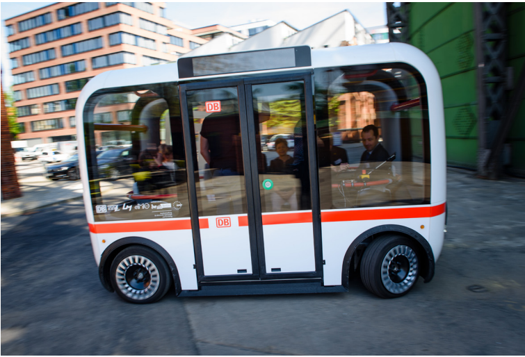
Digitalisierung überall – künftig auch auf dem Weg zur Aus- und Weiterbildung? Die Teilnehmenden können den selbstfahrenden Bus „Olli“ testen.