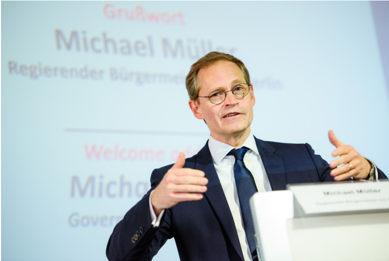
Michael Müller, Regierender Bürgermeister von Berlin

Zu Beginn seines Grußworts betont der Regierende Bürgermeister Michael Müller , dass sich durch die Digitalität die Arbeit wandeln wird. Wandel begleite uns und zeige sich auch in der jüngsten Geschichte des Veranstaltungsortes, einem ehemaligen großartigen Industriestandort, der seit 2007 als EUREF-Campus genutzt wird. Während 2011 650 Menschen hier arbeiteten, seien es heute 2.500 Arbeitsplätze, die an diesem Ort geschaffen wurden. Somit sei dieses Areal einer der Zukunftsorte Berlins; hier ließe sich bspw. mit dem selbstfahrenden Bus „Olli“ auch am praktischen Beispiel erfahren, was neue Mobilität konkret bedeutet. Die Veränderungen umfassten jedoch auch den Klimabereich. Bis zum Jahr 2050 seien weitreichende Ziele benannt, deren Umsetzung in Berlin bereits begonnen habe.