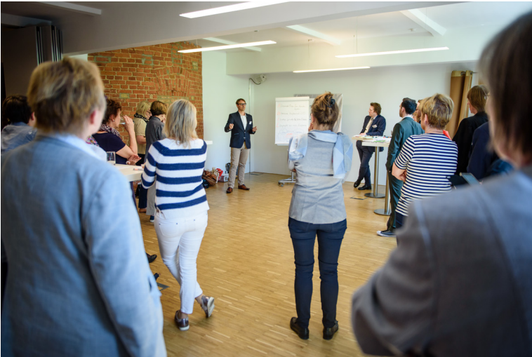
Auch die Teilnehmenden der Themeninsel 3 definieren nicht die neu zu schaffende Digitalkompetenz, sondern sehen einen Bedarf vieler verschiedener Kompetenzen. Bei der Anpassung der Weiterbildungsangebote seien zudem übergeordnete kulturelle, organisatorische und managementbezogene Faktoren entscheidend.