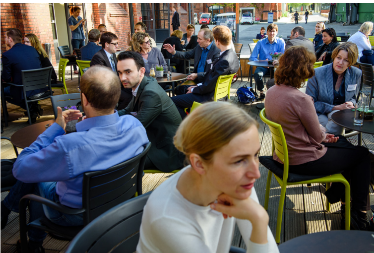
Teilnehmende vor Veranstaltungsbeginn auf dem EUREF-Campus