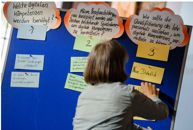
Die Teilnehmenden der Themeninsel 1 arbeiten heraus, dass durch die Digitalisierung zusätzliche Kompetenzen benötigt werden, die in der Berufsausbildung durch kompetente Berufsschullehrende vermittelt werden müssen.