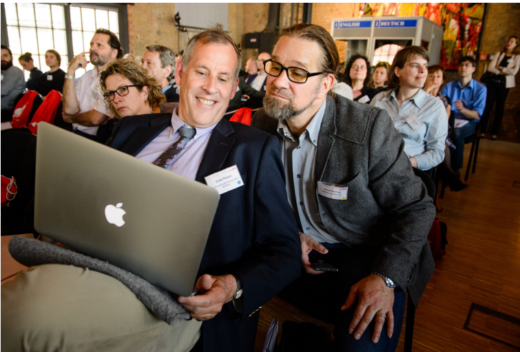
Das mobile Büro? Inhalte vom Laptop ergänzen die Vorträge.